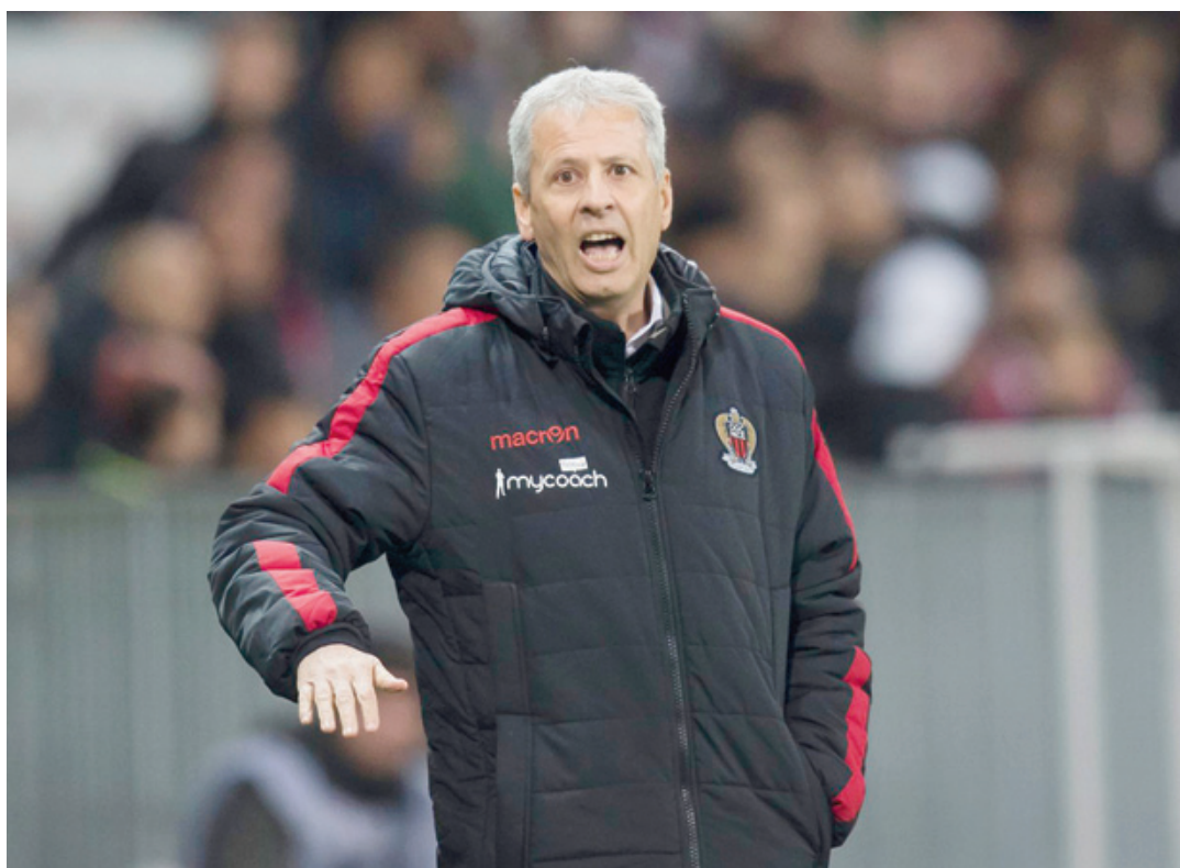
Après un intermède de deux ans en Ligue 1 avec Nice, Lucien Favre dirigera le troisième club allemand de sa carrière: le Borussia Dortmund.